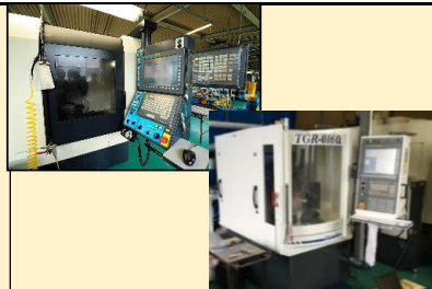
切削加工設備 再研磨設備