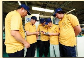
作業ミーティング