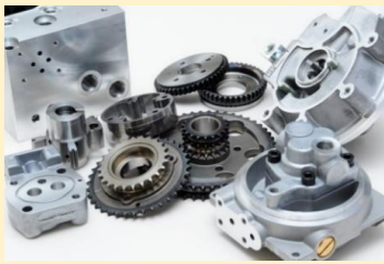
製品紹介： 焼結金属加工品 自動車用油圧ポンプ