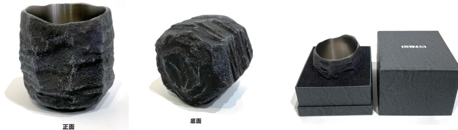
本事業の成果を基に製造した試作品